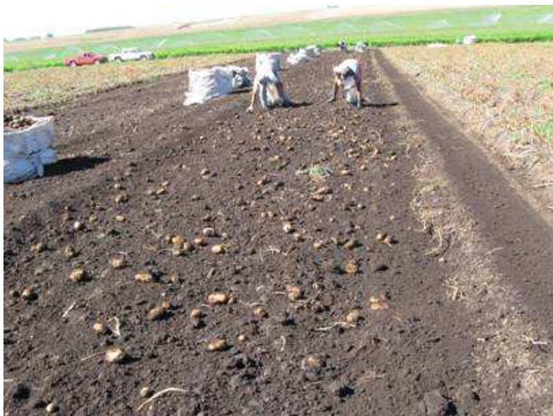
Figura 9. Pilas de papa en el SE Pcia de Buenos Aires